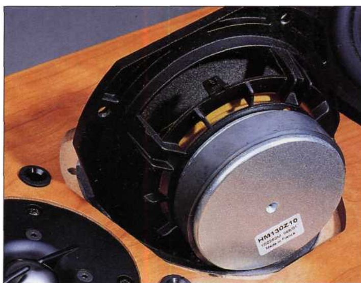
Le haut-parleur de 13 cm Audax HDA utilisé en médium et médium-grave. Noter le bon dégagement consenti par le saladier moulé et les ouvertures périphériques sous le spider.