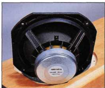
Les branches du saladier en Zamac ont un profil en U supprimant tout problème de flexion.

pour mettre au point ses charges et ses filtrages, mais sans perdre de vue la finalité musicale très subjective des produits. Finalité dont les logiciels et simulations les plus sophistiquées ne peuvent pas encore intégrer toutes les variables, loin s'en faut ! Il n'en reste pas moins important de tenter systématiquement une corrélation entre les mesures et l'écoute, l'hégémonie de la technique sur l'empirique, ou l'inverse, n'ayant à notre connaissance jamais abouti à des résultats probants ou du moins reproductibles... Ce pack "Prestige" a pour lui cette homogénéité de conception d'obédience très Hi-Fi.