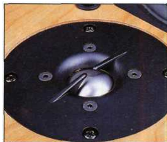
Un dôme titane avec une suspension rapportée pour un bon recouvrement avec le médium.