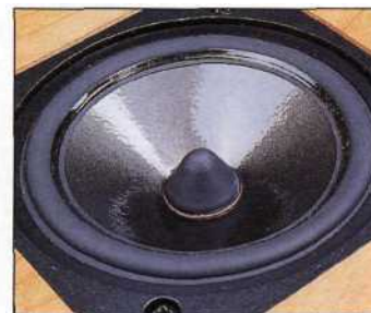
Une membrane Aerogel dont la suspension souple assure un débattement important...